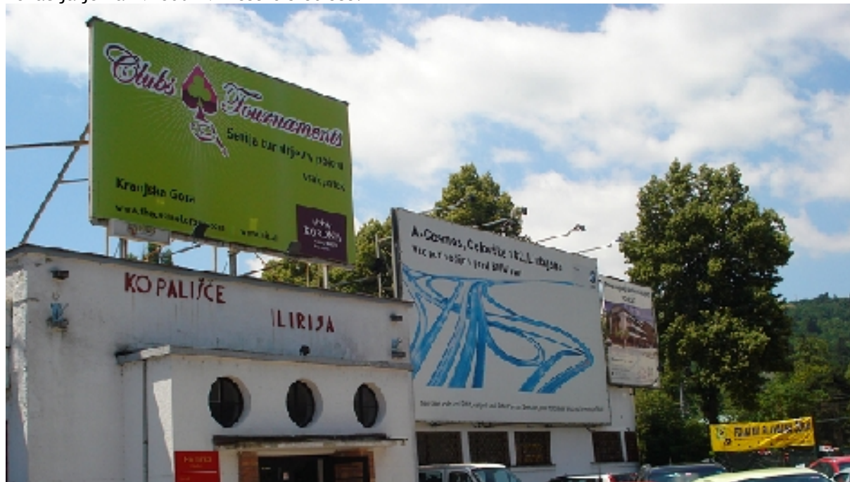
Pano nad vhodom - velikost: 7,03 m x 3,97 m

Oglasne površine so na steni, ki je vzporedna s Celovško cesto, pred križiščem s Tivolsko cesto. Lokacija je na »vhodu« v mestno središče.