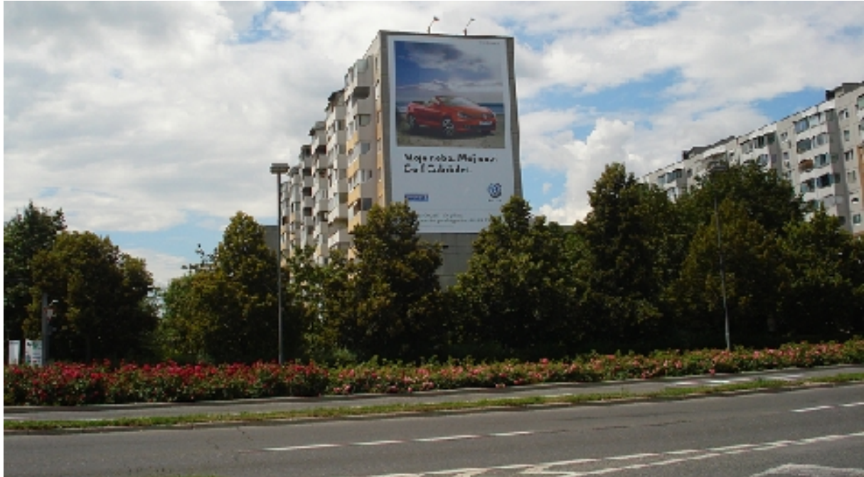
Kunaverjeva 1 - 3 - velikost: 11,84 m x 18,89 m

Oglasni površini sta na stanovanjskih blokkih ob Celovški cesti. Vidni sta iz treh smeri (iz centra LJ proti Gorenjski in obratno, iz smeri Maribora, v smeri proti morju).