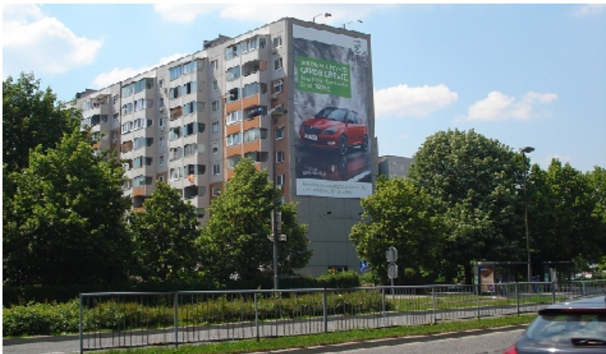
Kunaverjeva 2 - 4 - velikost: 11,78 m x 19,88 m